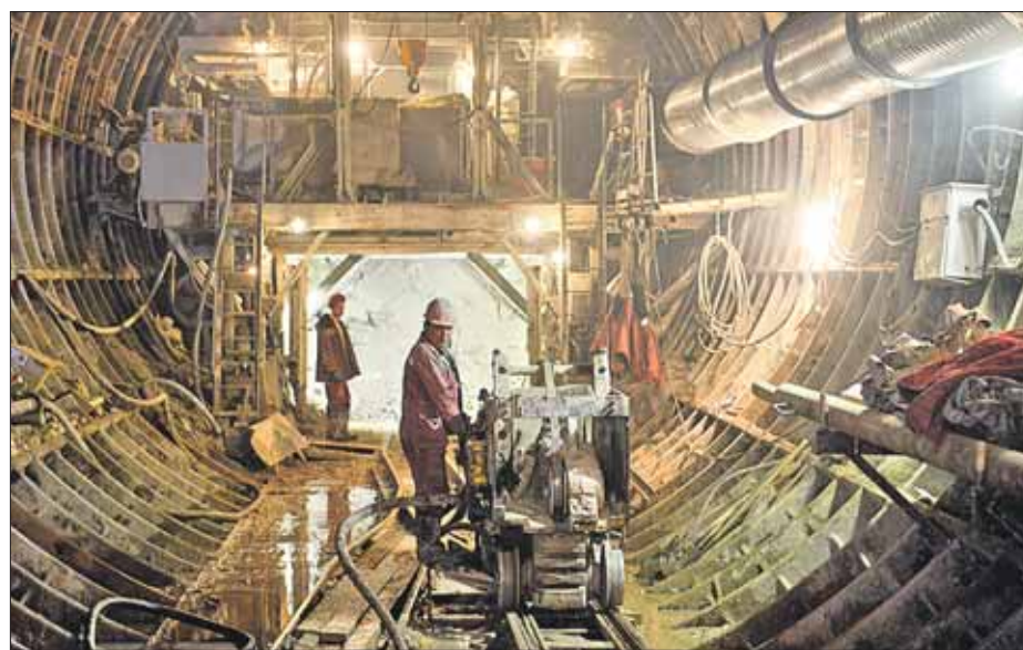
Так сейчас выглядит строящаяся станция «Фонвизинская»

Сейчас на будущей станции «Фонвизинская» идёт сооружение двух вестибюлей, по обе стороны улицы Милашенкова, и прокладка двух типов тоннелей — эскалаторных наклонных и