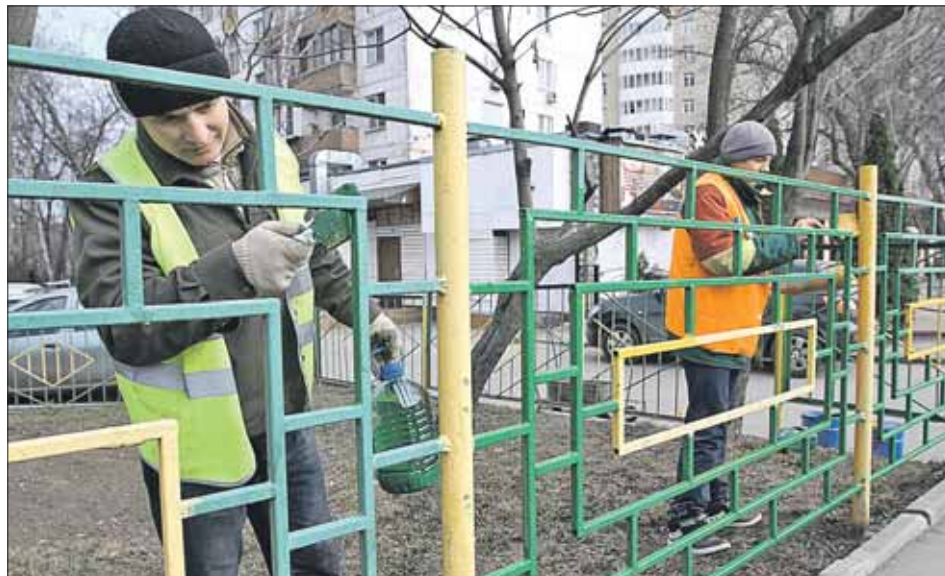
Забор на улице Яблочкова, 21, был покрашен одним из первых

Заказывайте инвентарь для благоустроительных работ во дворе по тел.: (495) 619-6970, (495) 610-4300