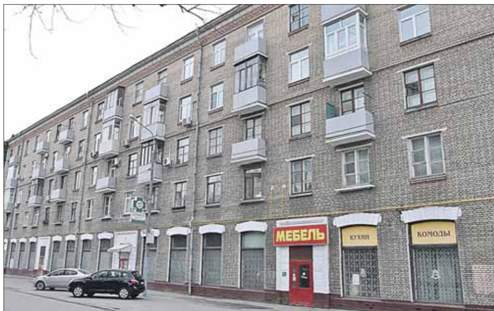
На улице Гончарова, 6, балконы отремонтировали в прошлом году

— Замена лифтов происходит в рамках городской программы. Ваш дом стоит в плане, значит, вам их заменят. По ремонту подъ-