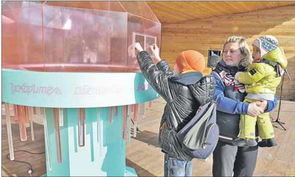
Проект закроют, когда «ускоритель» будет переполнен

— Мы решили подарить девушкам немного романтики, а заодно проверить,