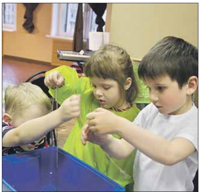
Идёт занятие в «экспериментальной лаборатории»

Летом в культурно-досуговом центре «Ключ» начнутся бесплатные занятия для детей 8-12 лет в «экспериментальной лаборатории», где с применением безопасных опытов ребята будут познавать мир вокруг себя, изучать физические, химические, природные явления.