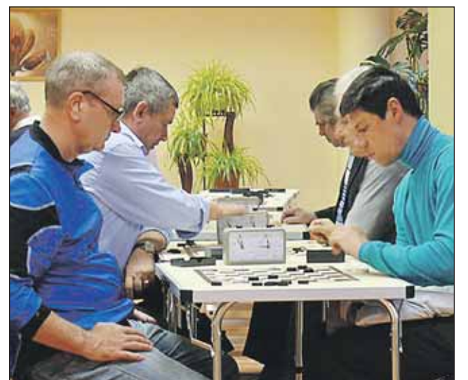
Состоялся шахматно-шашечный турнир

Библионочь в районной библиотеке на улице Яблочкова, 43, прошла удачно. Для гостей работали 5 площадок, организованных с учётом предпочтений посетителей. Юные читатели превратились в команду кладоискателей, а помещенные библиотеки — в Остров сокровищ.