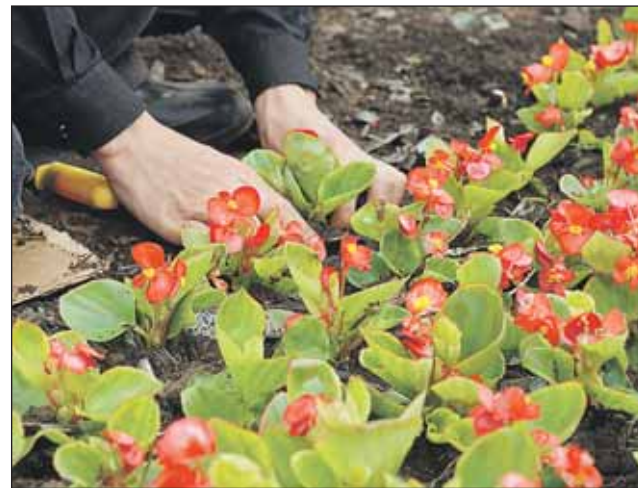
Разбить цветники запланировано до 30 мая

На территории улицы Яблочкова вдоль Савёловской железной дороги в 2012 году ГКУ «Дирекция ЖКХиБ» проведены работы по благоустройству. В управе Бутырского района сообщили, что выполнение отдельных видов работ: ремонт газона, ограждений, устройство цветников, устройство площадки для изучения правил дорожного движения и устранение выявленных замечаний — были перенесены на весенний период до 30 мая 2013 года. В настоящее время заказчиком работ по инициативе