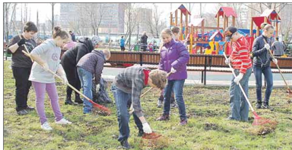
Каждый год наши школьники и студенты принимают активное участие в субботниках

Управа Бутырского района горячо благодарит всех жителей, принявших участие в субботниках, за активную жизненную позицию и помощь в уборке и благоустройстве нашего района. Во дворы и на улицы вышли взрослые и юные жители, сотрудники промышленных предприятий, работники ЖКХ. Традиционно