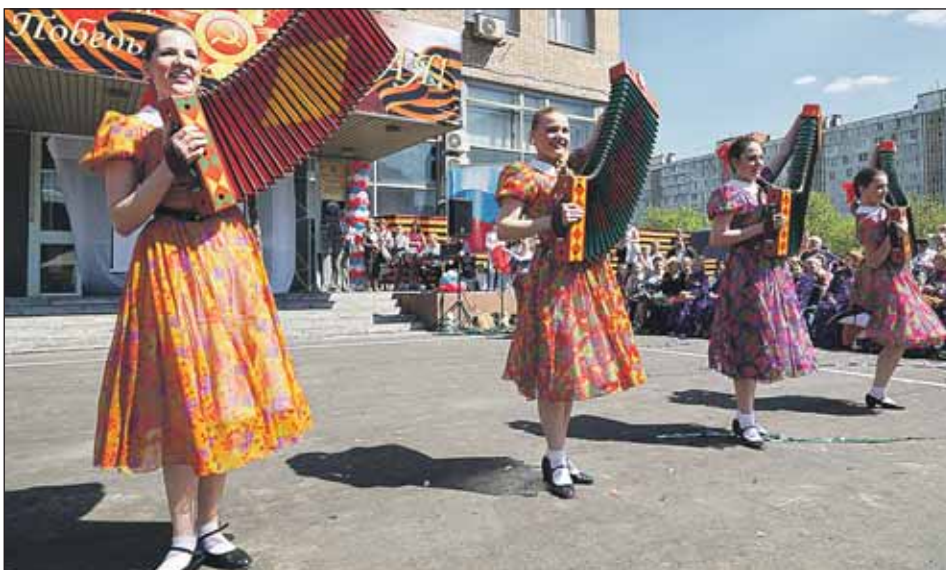
Концерт для ветеранов подготовили творческие коллективы района

— Требования к благоустройству уже отработаны: все детские площадки должны быть с резиновым покрытием и в целом должен соблюдаться комплексный подход. Будут в нашем районе и свои особенности: мы планируем применять инновационные решения при озеленении дворов, освеще-