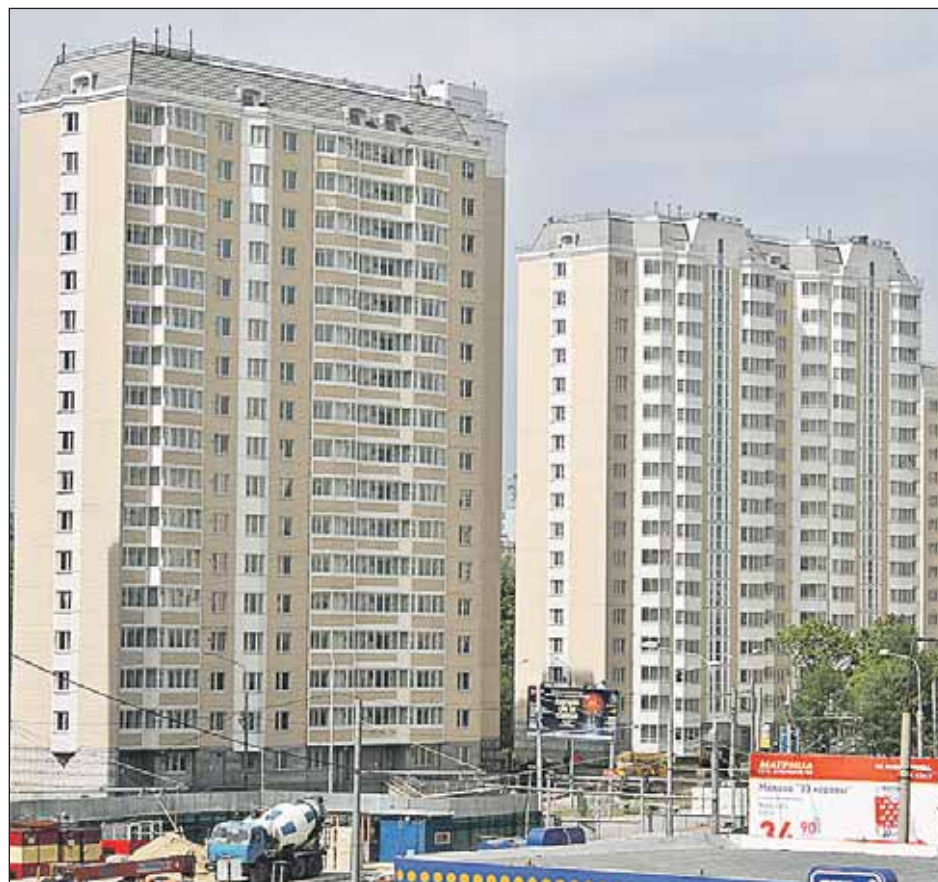
Жители начали смотреть свои квартиры в новостройках на улице Милашенкова