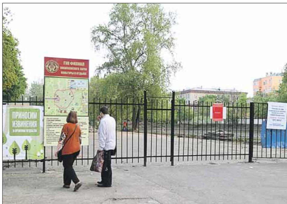
Реконструкция излюбленного места отдыха жителей нашего района — парка на улице Гончарова завершится ко Дню города

— В случае плохой работы они будут нести серьёзную ответственность. Гораздо более серьёзную, чем было раньше.