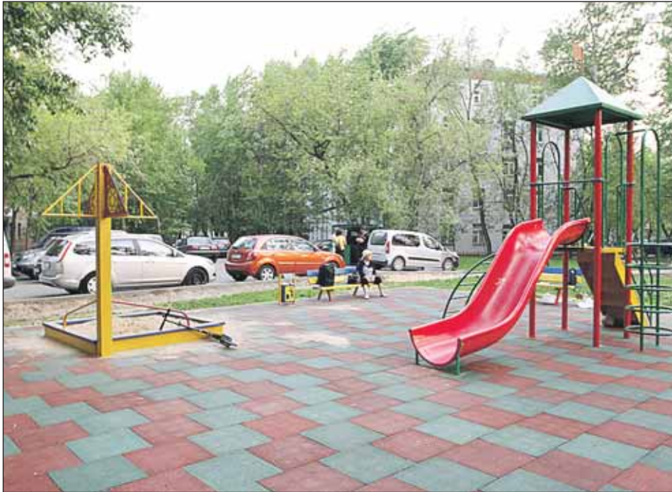
Депутат Ольга Рощина, архитектор по образованию, участвовала в разработке проекта площадки на улице Добролюбова, 27

Кроме этого, благодаря моему депутатскому запросу в управу удалось произвести монтаж «лежащих полицейских» на дороге у того же дома 27 по Добролюбова. Жители неоднократно об-