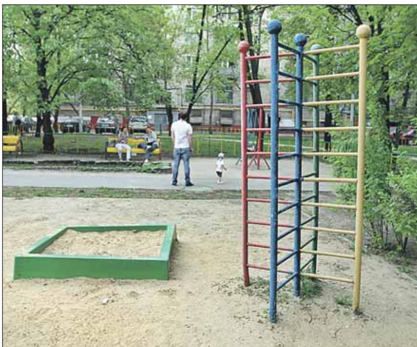
Имеющиеся во дворе игровые формы морально устарели

Как сообщили в управе района, дворовая территория по адресу: ул. Бутырская, 2, 4, 6, включена в программу благоустройства дворовых территорий на 2013 год. В ходе реализации