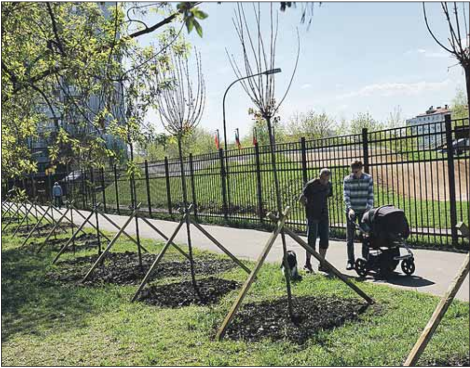
На территории между велодромом, детским садом и домами 37в и 43 на улице Яблочкова запланировано дополнительное благоустройство