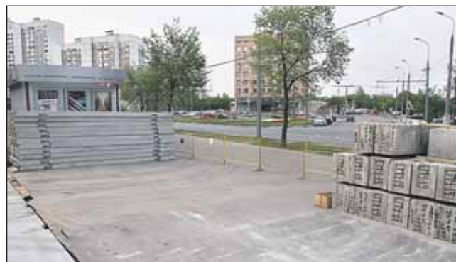
Стройплощадка у домов 37, 41 и 41а на улице Яблочкова

Необходимо рассмотреть возможность изменения границы стройплощадки, чтобы сохранить ярмарку выходного дня у дома 37 по улице Яблочкова.