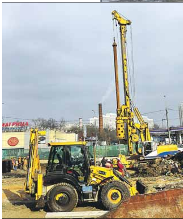
Стройплощадка метростроевцев на улице Милашенкова, 1 и 2