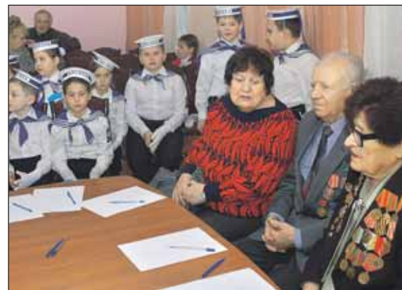
В жюри конкурса вошли почётные гости — ветераны