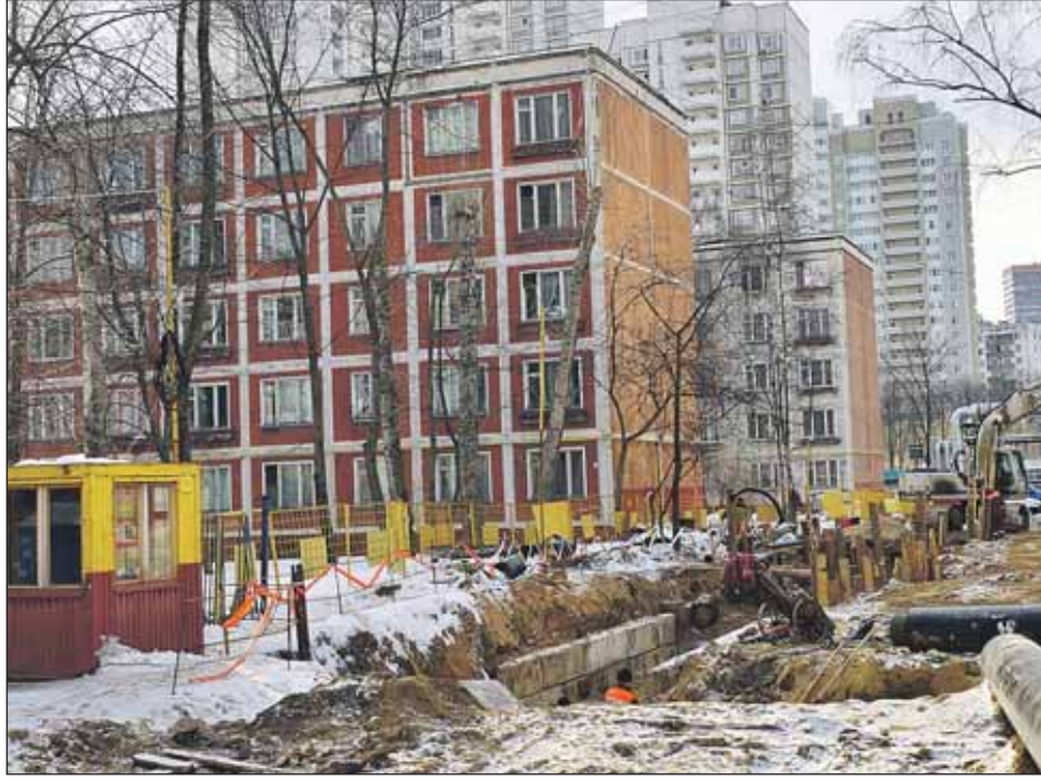
Пятиэтажки на улице Милашенкова, 3, корпуса 3, 4, предназначены под снос

— Потребовалось большое количество времени, чтобы утрясти все проблемы. Волновое переселение подразумевает, что сначала надо построить новые дома, нельзя переселять людей в никуда, — сказал префект, отвечая на вопрос жителей о том, почему пятиэтажки сносятся так медленно.