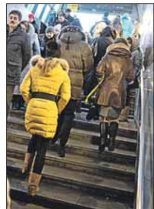
В переходе уменьшилось количество торговцев

Как сообщили в управе, 6 февраля 2013 года проведено оперативное совещание по вопросу содержания железнодорожного перехода под платформой Тимирязевская и обеспечения соблюдения общественного порядка с участием начальника дистанции инженерных сооружений Московской железной дороги (балансодержатель), руководителей подрядных организаций, начальника линейного отделения внутренних дел на станции Москва-Савёловская. По состоянию