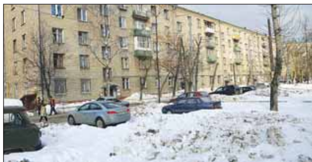
Двор на улице Фонвизина, 14

Глава управы района Алексей Беляев сообщил, что на месте снесённых гаражей-«ракушек» на ул. Фонвизина, 14, будет открытая автопарковка.