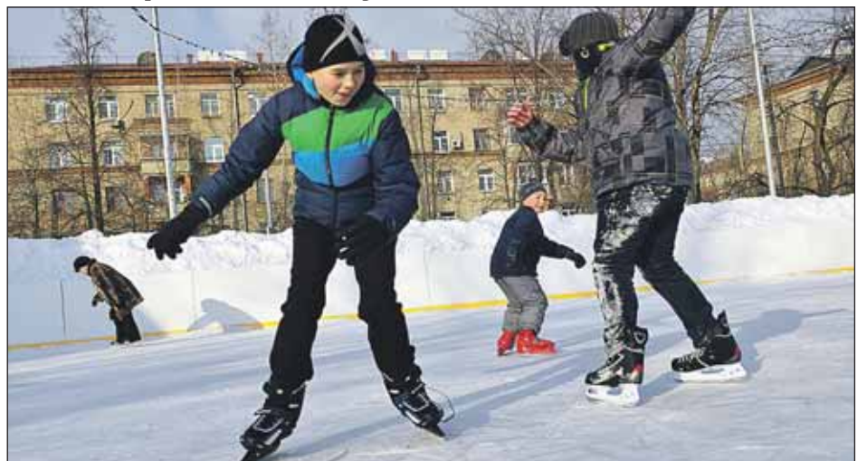
Проект подключения искусственного катка на улице Гончарова согласован с МОЭСК

● Рядом с нашим домом, с домами 17 и 19 по улице Добролюбова и другими пятиэтажками заработал каток с искусственным льдом. Работы по подключению холодильного оборудования катка к нашей трансформаторной подстанции (ТП) во дворе, обслуживающей 6 пятиэтажек, были выполнены непрофесси-