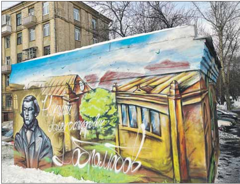
Двор на улице Добролюбова. В 2012 году ЦТП оформляли по названию улиц района

Также художникам предложат оформить борта