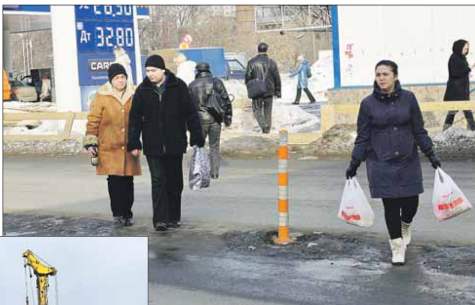
Люди продолжают переходить улицу Милашенкова у ТЦ «Матрица», невзирая на отсутствие «зебры» и светофора

ГИБДД согласна с восстановлением регулируемого пешеходного перехода